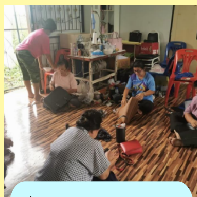
กลุ่มหัตถกรรม ม.5 ต.เกาะลอย