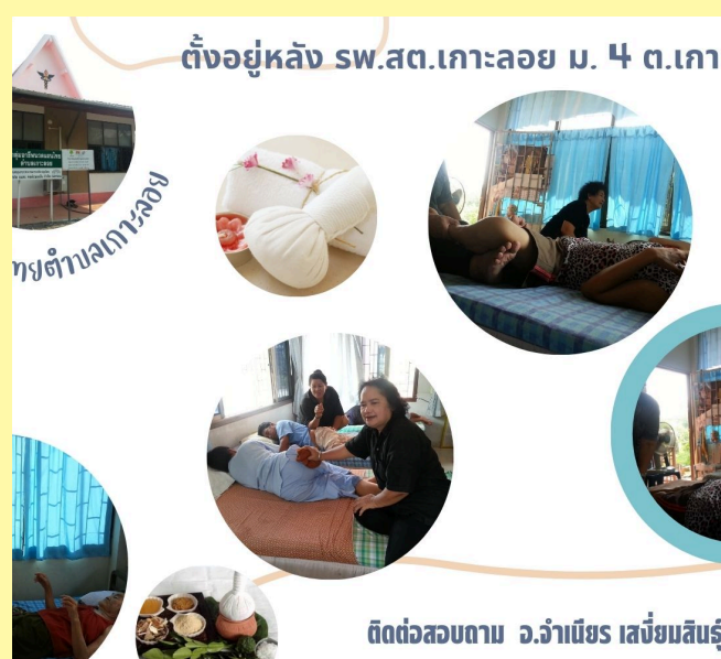
ศูนย์นัดแนะไทย วัดยุคคณาษฎร์สามัคคี