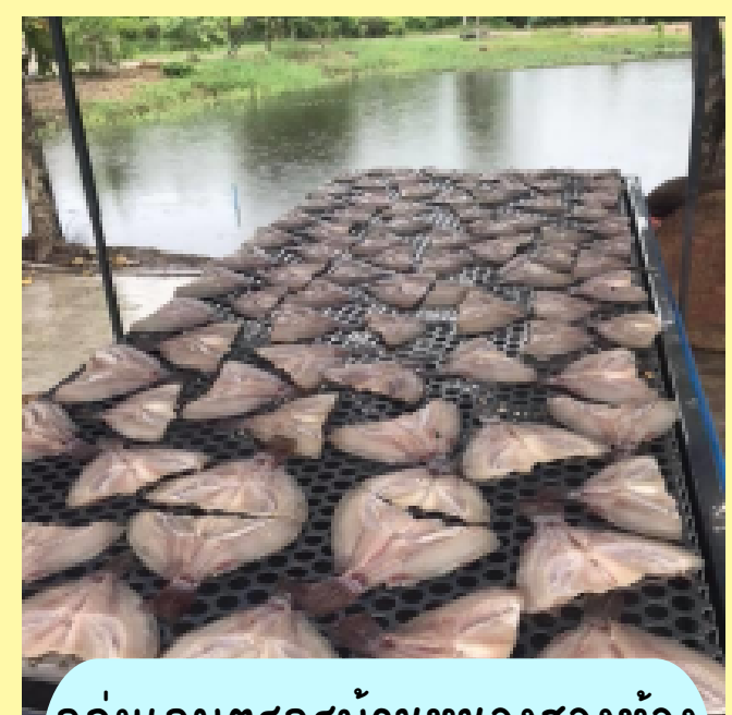
กลุ่มเกษตรกรบ้านหนองสองห้อง ม.2 ต.บางหัก