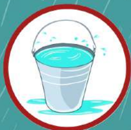
ถังน้ำใช้