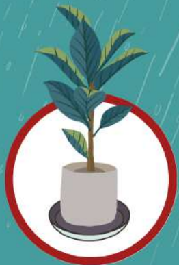
จานรอง กระถางต้นไม้

แหล่งวางไข่ยุงลาย สามารถเกิดขึ้นได้จากภาชนะที่มีน้ำขัง ไม่ว่าจะเกิดขึ้นเองตามธรรมชาติ หรือจากสิ่งที่มีมนุษย์สร้างขึ้น หากปล่อยทิ้งไว้ อาจทำให้ยุงลายมาวางไข่ได้