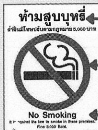
เครื่องหมายเขตปลอดบุหรี่

เจ้าของสถานที่ที่มีหน้าที่ประชาสัมพันธ์ แจ้งเตือน ควบคุมดูแลห้ามปราม หรือดำเนินการอื่นใด เพื่อไม่ให้เกิดการสูบบุหรี่ในเขตปลอดบุหรี่