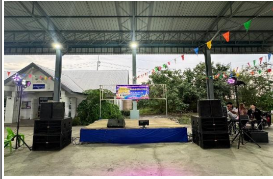
ภาพถ่ายการดำเนินงาน