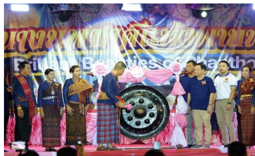
ภาพถ่ายการดำเนินงาน